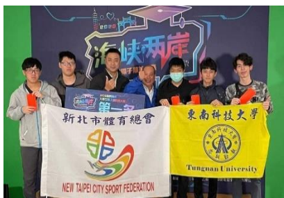
「2020第四屆海峽兩岸大學生電子競技大賽」東南飛鷹隊獲得冠軍