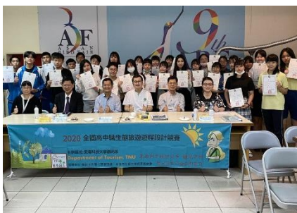
與台北市七星生態保育基金會共同舉辦「2020全國高中職生態旅遊遊程設計競賽」