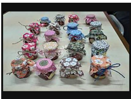
產品研發-茶業融入果醬產品