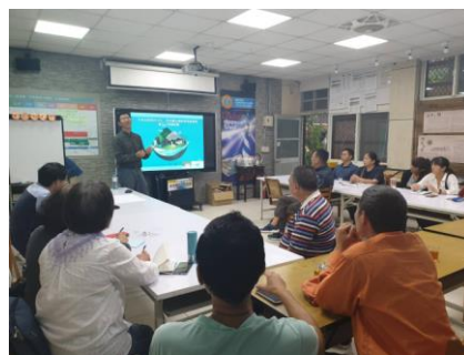
菁桐在地導覽人才培訓