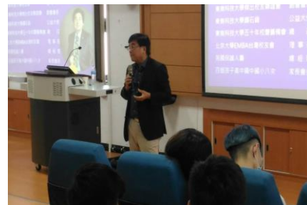
109.6.4我的奮鬥人生~我讀過 (人文講座)