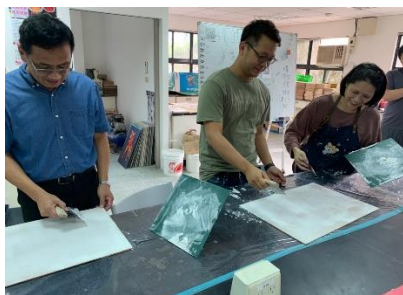
跨域設計教師專業成長社群