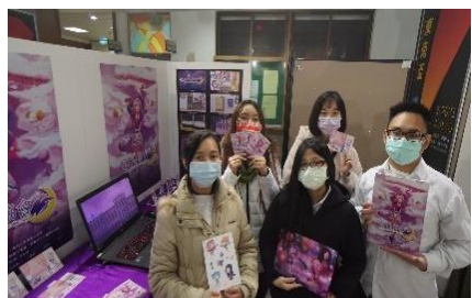
跨領域實務專題-夢羊者協會