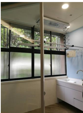
樂齡智慧室內空間場域建置