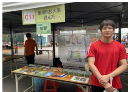
「2020臺北自然生態保育活動」宣達「新店散步走」摺頁成果