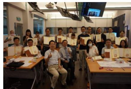
創新創業教師輔導團培訓