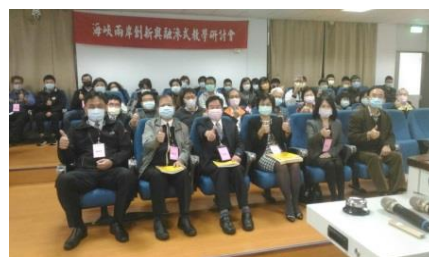
第七屆海峽兩岸創新與融滲式教學研討會