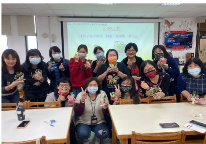
休閒觀光產業七年一貫學習不斷教師社群