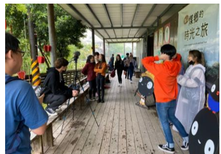
新平溪煤礦園區導覽拍攝