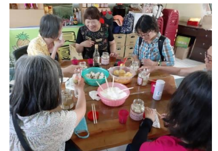
青銀同樂轉運站-109.7.24鳳梨醬 DIY