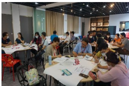
創新創業教師輔導團培訓