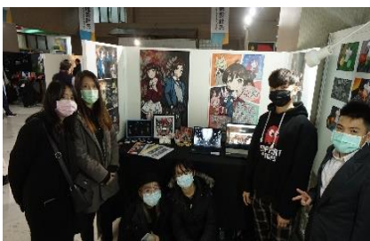
跨領域實務專題-少年、少女