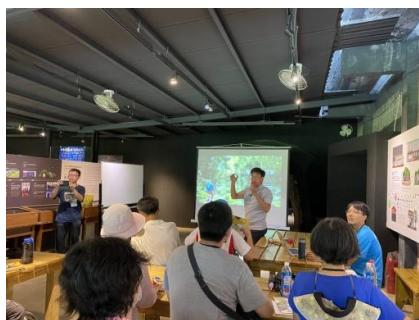
綠色淡蘭遊程設計工作坊