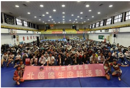
109年度北區僑生迎新聯誼園遊活動