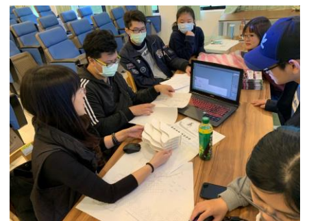
樂齡智慧住宅室內設計與裝修培育工作坊