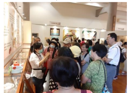
點亮桃花源生活-109.8.14郭元益糕 餅店DIY傳統鳳梨酥