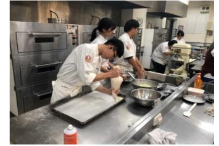
109.3.25實習餐廳體驗 (大學體驗營)