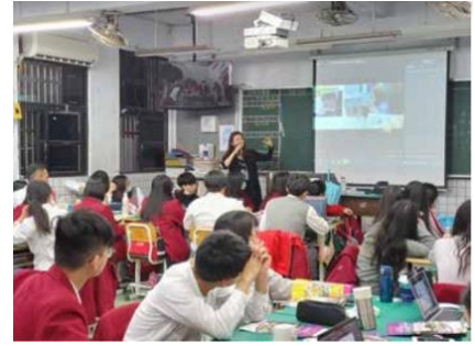
室設系跨校TA赴復興商工協助教師 專業指導