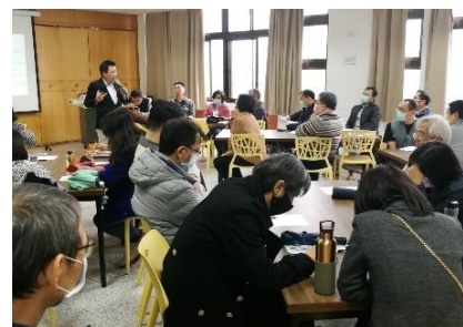
109.12.9學習共同體教學工作坊