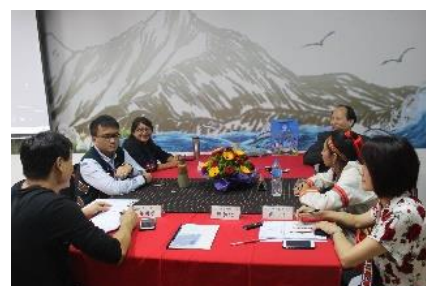
原住民族學生資源中心諮詢委員會議