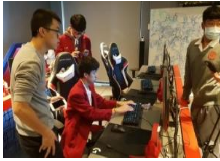
數遊系跨校TA赴復興商工協助專題 指導