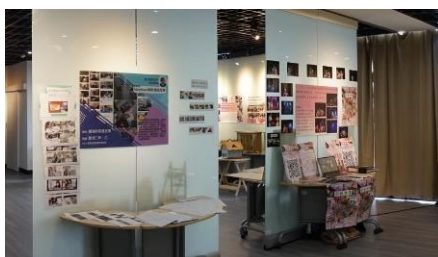
教學改進課程期末成果展