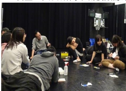
弱勢學生就業轉銜座談會