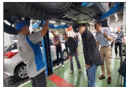
109.10.11-10.18 TSS 2.0自動駕駛技術深度體驗營(教師產業實務研習)