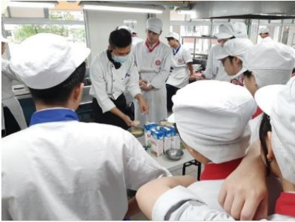
餐旅系跨校TA赴滬江高中協助教師 專業指導