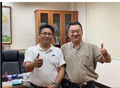
109.9.24拜訪石碇區長討論場域計畫推動