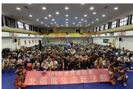
109年度北區僑生迎新聯誼園遊活動