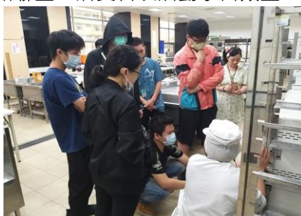
弱勢學生職業生涯團體工作坊