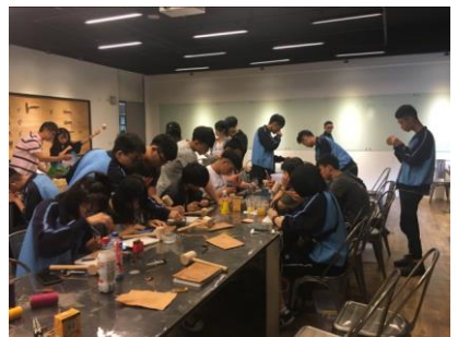
109.5.11皮革飾品設計體驗 (大學體驗營)