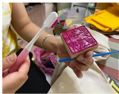
淡蘭文創商品研發(個人化特色小包)