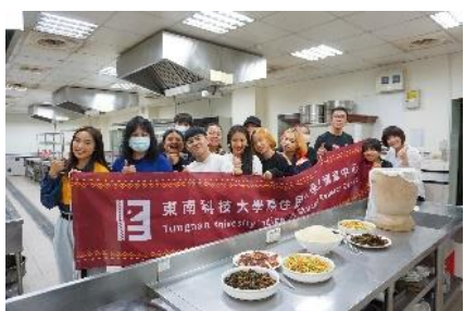
原住民族部落偏鄉文化營隊-真的是“美”味