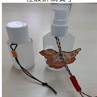
產品研發-當地綠竹筍純露水