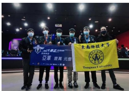
東南飛鷹隊「2020第二屆大專盃電競錦標賽-英雄聯盟總決賽」獲得亞軍