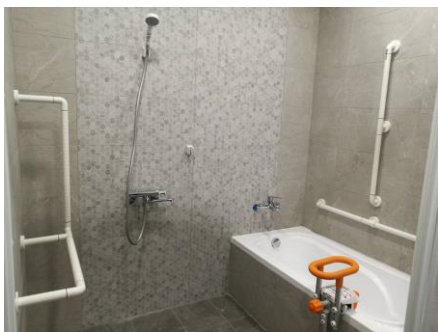
樂齡智慧室內空間場域建置

● 發展樂齡產業課程： 完成樂齡智慧宅展示空間建置，舉辦3場工作坊，學生參加內政部建築研究所「第十三屆創意狂想·築向未來-智慧化居住空間創意競賽」榮獲1組佳作。開設4門高齡樂活產業培育課程，修課學生達118人，研發28道銀髮族料理，於109年12月31日舉辦品嘗發表會。