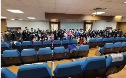
2020東南盃創新設計競賽 (專業聯合專業競賽)