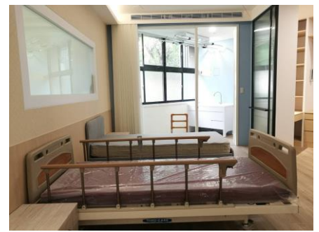
樂齡智慧室內空間場域建置