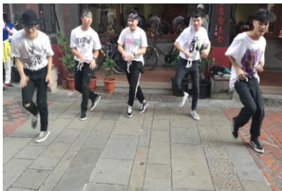
表演藝術系學生深坑老街藝術表演