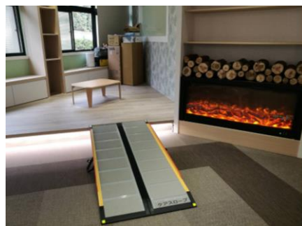
樂齡智慧室內空間場域建置