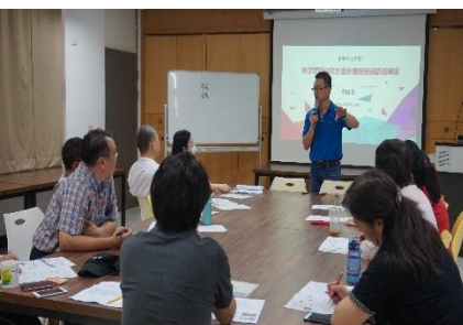
109.7.3教學實踐研究計畫撰寫指南與拆招解密工作坊