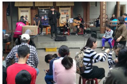
表演藝術系學生深坑老街駐唱