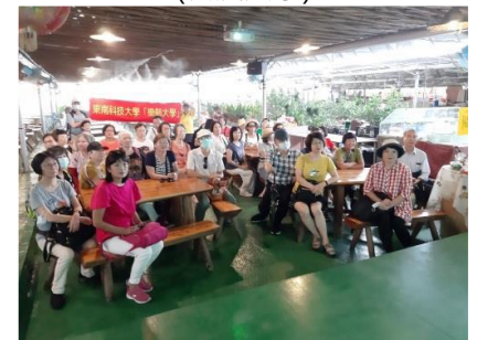
走讀樂活趣-109.8.14關西番茄聯合國