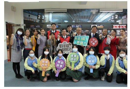
航空英語體驗「一日空服員」

● 發展樂齡產業課程： 完成樂齡智慧宅展示空間建置，舉辦3場工作坊，學生參加內政部建築研究所「第十三屆創意狂想·築向未來-智慧化居住空間創意競賽」榮獲1組佳作。開設4門高齡樂活產業培育課程，修課學生達118人，研發28道銀髮族料理，於109年12月31日舉辦品嘗發表會。