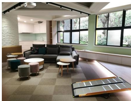
樂齡智慧室內空間場域建置