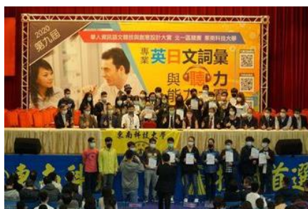
2020專業英日文詞彙與聽力能力大賽學生獲得5個冠軍9個亞軍8個季軍