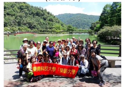
點亮桃花源生活-109.7.24望龍埤生 態之旅