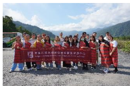
原住民族文化活動工作坊-以~花那麼漂亮