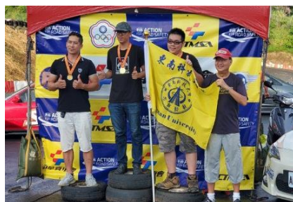
「全國2020 TAGC金卡納賽車」本校東南大車隊獲1金1銀2銅佳績