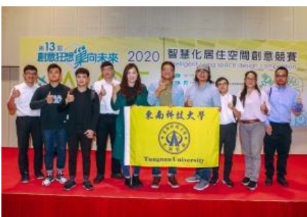
第十三屆「創意狂想 築向未來」智慧化居住空間創意競賽榮獲1組佳作、2組入選獎