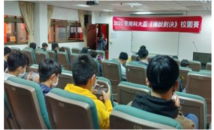
2020東南盃傳說對決校園賽 (專業聯合專業競賽)