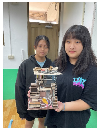
照片 6 說明：成果發表照