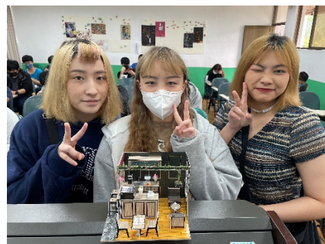
照片 3 說明：成果發表照