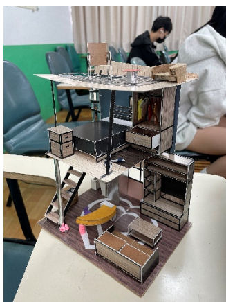
照片 4 說明：成果發表照