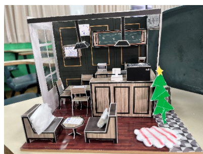
照片 5 說明：成果發表照