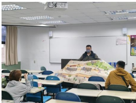
業師提供實作討論