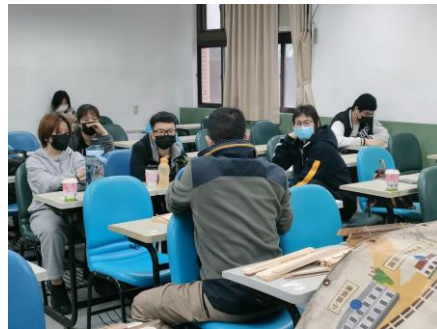
業師與同學課堂討論