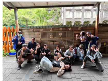
同學完成實作逞品