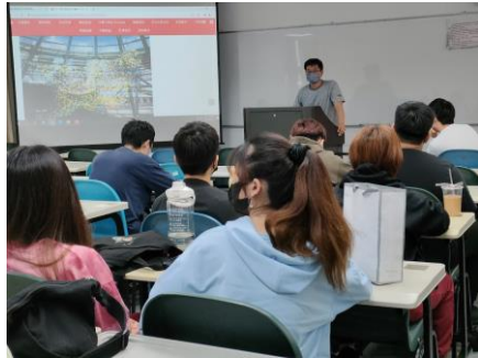
業師課堂分享案例