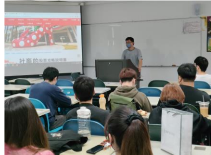
業師課堂分享案例