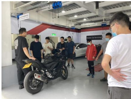
黃牌檔車特性及性能