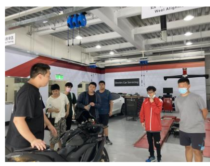
黃牌檔車檢驗與操作