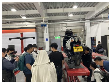
大型速克達檢驗項目說明