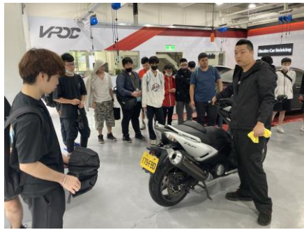
大型速克達特性及性能