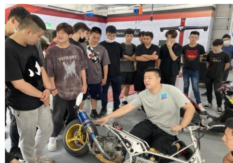
機車改裝合法項目