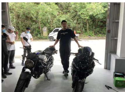
紅、黃牌檔車特性及性能差異