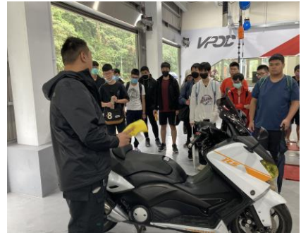
大型速克達保養檢查項目