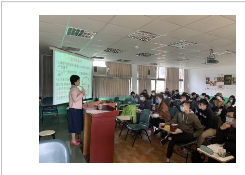
說明：老師授課照片 1