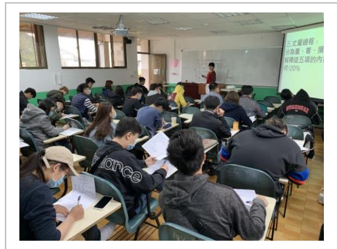
說明：老師授課照片 2