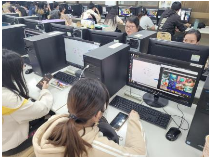
老師職場心得分享