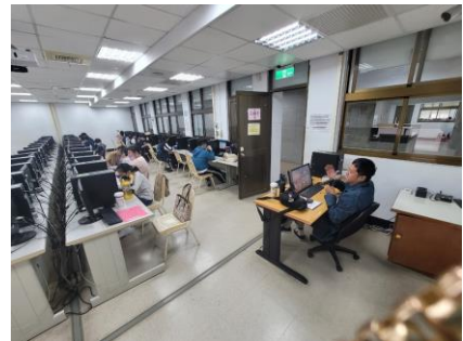
老師職場心得分享