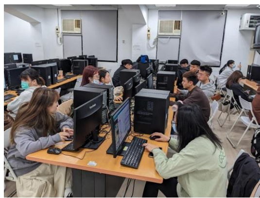
照片 3 說明：證照考試