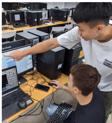
照片 4 說明：證照輔導