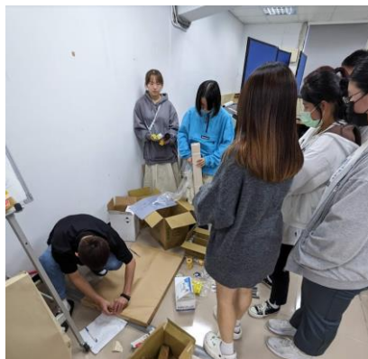
照片 1 說明：分發模型材料