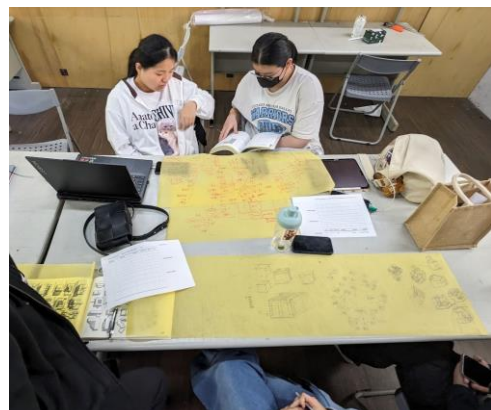
照片 6 說明：設計討論過程