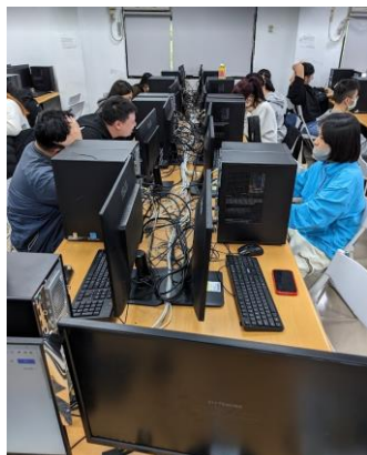
照片 5 說明：證照輔導