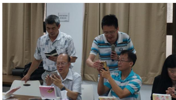
文字說明：老師們與講者討論使用心得