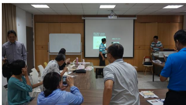
文字說明：老師們與講者共同討論