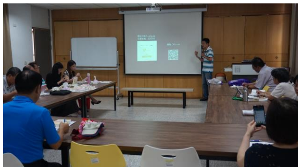
文字說明：授課者教學實況