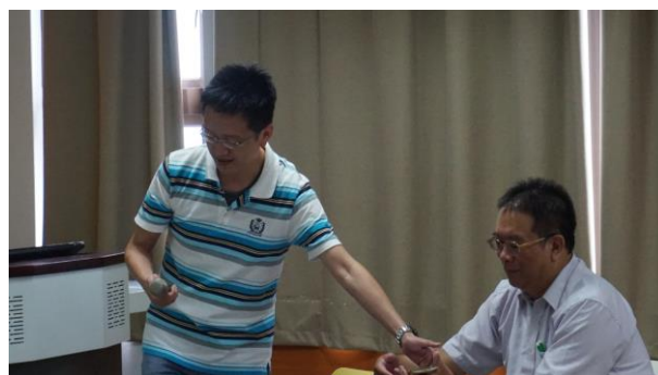
文字說明：授課者教學實況