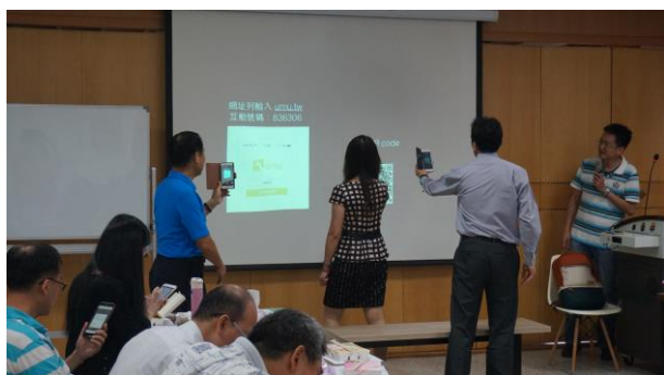
文字說明：老師掃描 QR Code