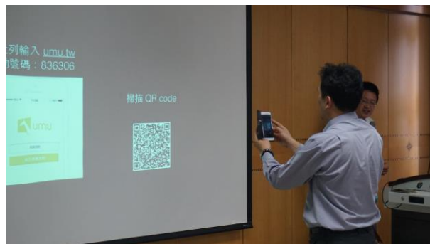
文字說明：老師掃描 QR Code