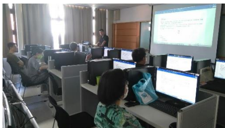
照片 2 說明：研習情形