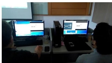
照片 4 說明：參與教師認真上課