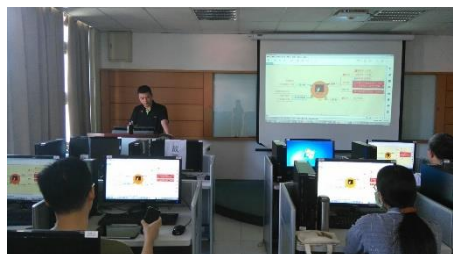
照片 1 說明：研習情形