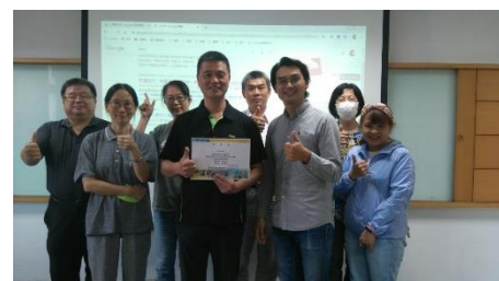
照片 6 說明：參與教師合照留念