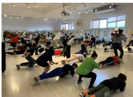
照片 1 說明：做體能