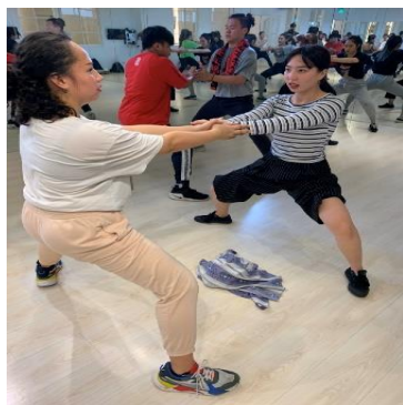
照片 4 說明：同學互相拉筋