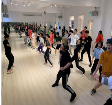
照片 5 說明：排舞