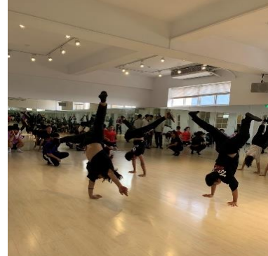
照片 6 說明：進階動作