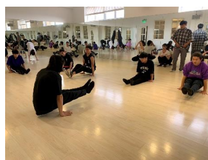
照片 3 說明：課程動作說明