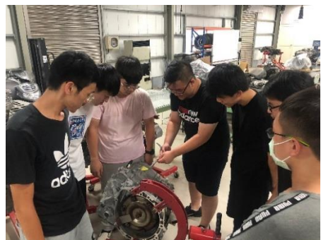
照片 4 說明：架上變速箱操作