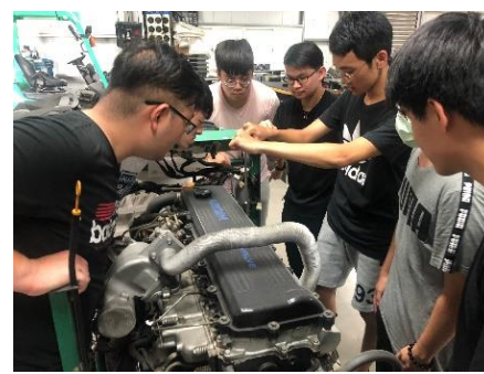
照片 3 說明：架上柴油引擎操作