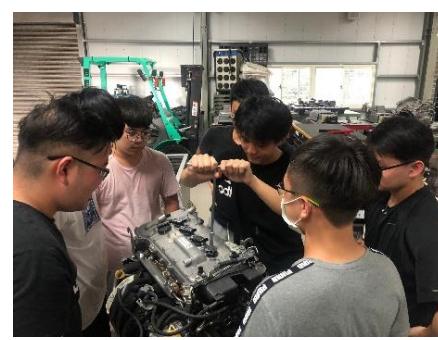
照片 6 說明：架上汽油引擎操作