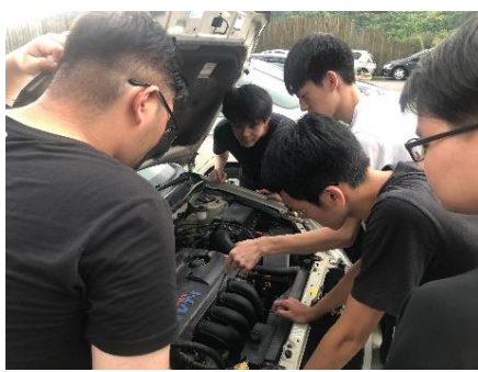
照片 2 說明：實車汽油引擎操作