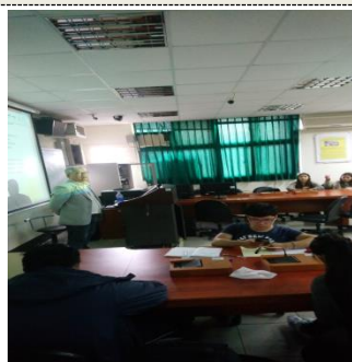
照片 5 說明：業師上課情形