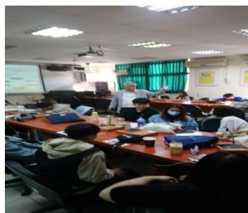
照片 1 說明：業師上課情形