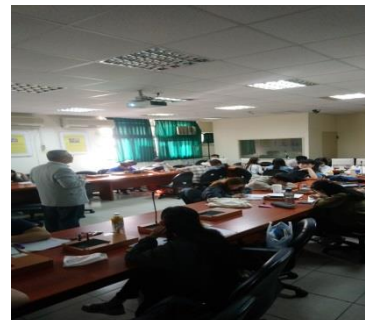
照片 3 說明：業師上課情形