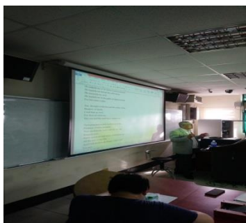
照片 2 說明：業師上課情形