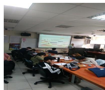
照片 6 說明：業師上課情形