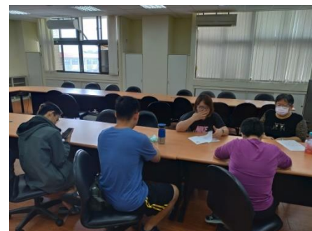
照片 6 說明：課程討論