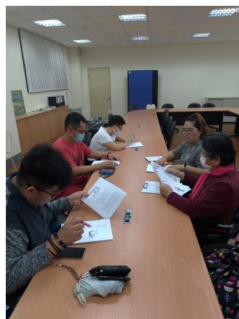
照片 2 說明：課程分享