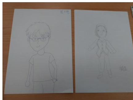
照片 5 說明：學生團體課程作品