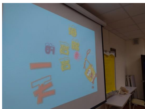
照片 1 說明：學生團體課程操作