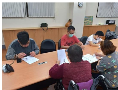
照片 4 說明：學生一同討論