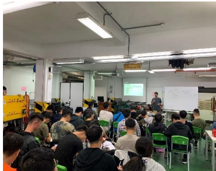
照片 2 說明：各站說明