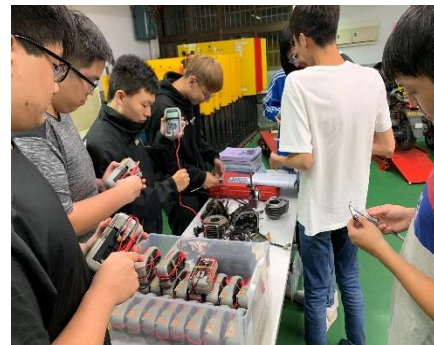
照片 3 說明：三用電錶基本操作