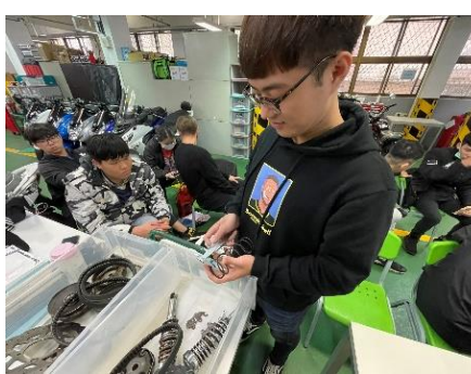
照片 6 說明：量測操作