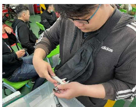
照片 5 說明：量測操作