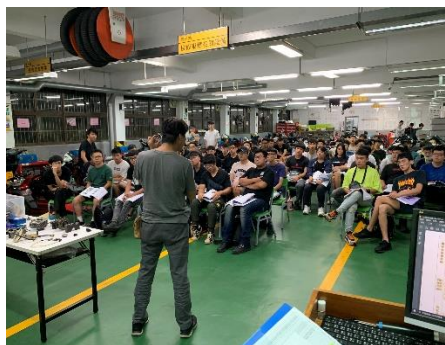
照片 1 說明：課程解說