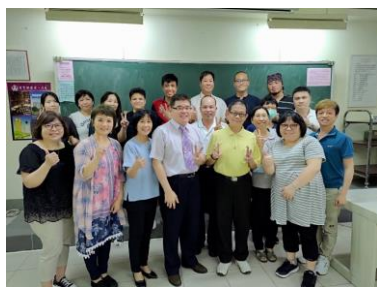
照片 4 說明：課程結束業師與學生合影