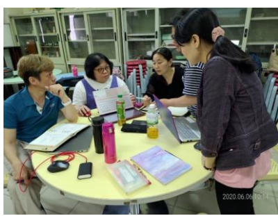
照片 2 說明：學生討論互動情形