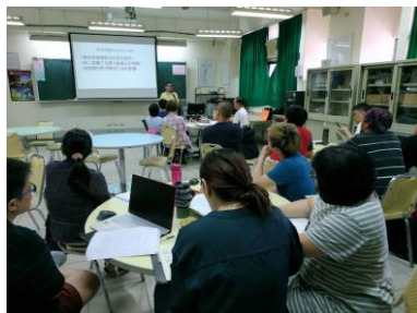
照片 5 說明：業師上課與學生互動情形