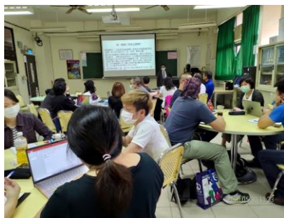
照片 1 說明：業師上課與學生互動情形