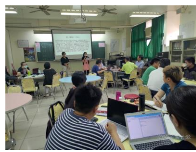
照片 3 說明：學生上台發表情形