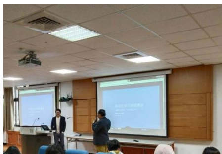
照片 1 說明：研發長開場介紹講師