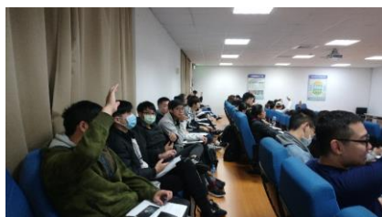
照片 5 說明：活動結束接受同學提問