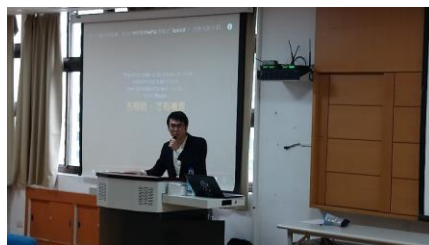
照片 2 說明：講師開講