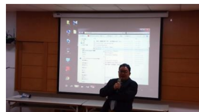
照片 6 說明：會後師生與講師進一步溝通