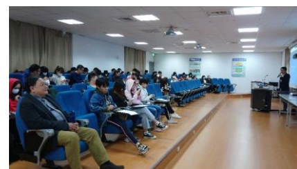
照片 3 說明：參與師長及學生