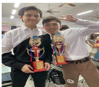
照片 2 說明：110 年全國勞工菁英盃歌唱大賽歌藝超群獎以及優勝獎