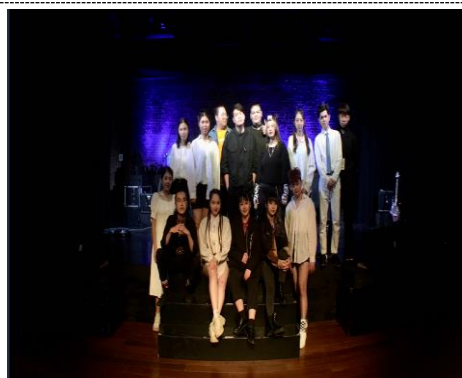
照片 1 說明：西門紅樓 眾生之愛皆是愛