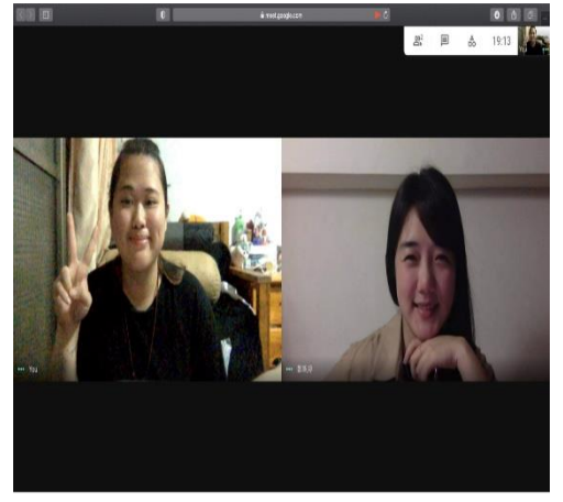
照片 6 說明：與專家老師遠距視訊上課