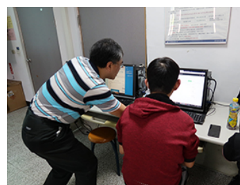
照片 3 說明：同學認真學習