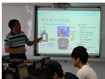
照片 1 說明：同學認真學習