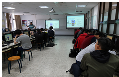
照片 2 說明：業師分享職場經驗