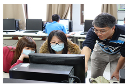
照片 5 說明：同學主動詢問老師