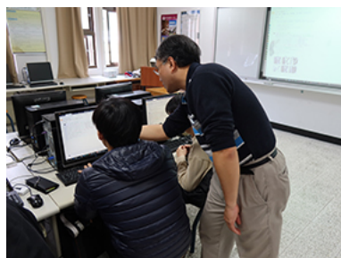
照片 4 說明：同學與業師互動良好