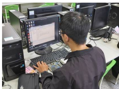
照片 4 說明：同學認真操作