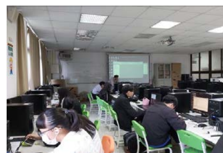
照片 6 說明：業師上課情形