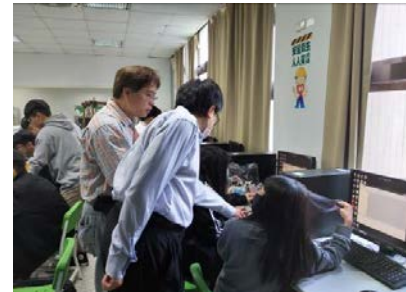
照片 3 說明：業師協助同學解決問題