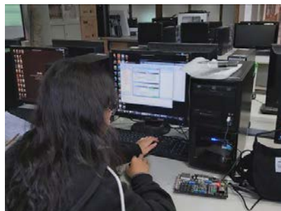
照片 5 說明：同學認真操作