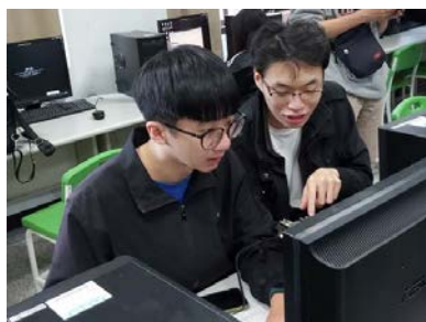
照片 2 說明：同學討論如何操作