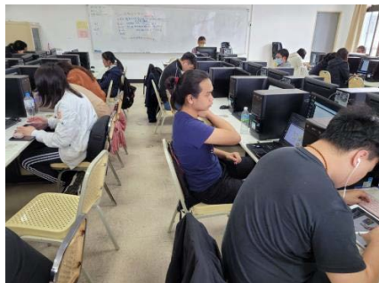
照片 5 說明：業師上課情形