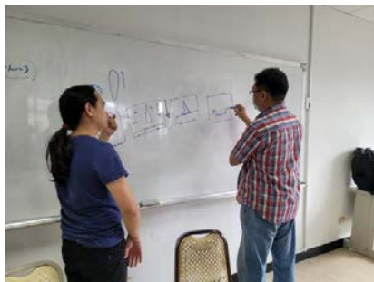
照片 1 說明：業師上課情形