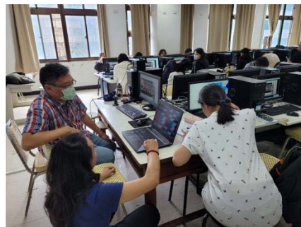
照片 2 說明：業師上課情形