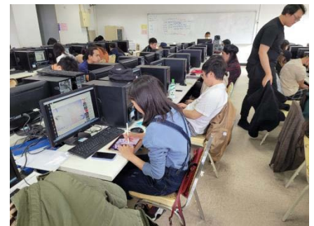
照片 3 說明：業師上課情形