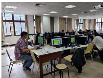
照片 4 說明：業師上課情形