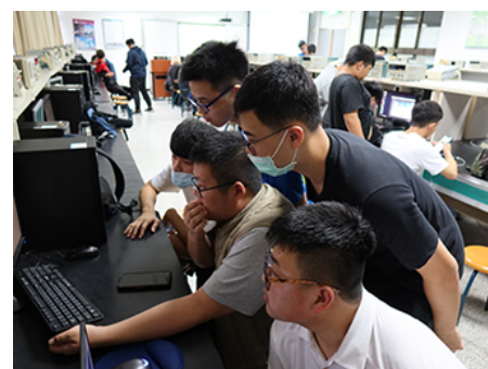
照片 6 說明：各組成員熱烈討論