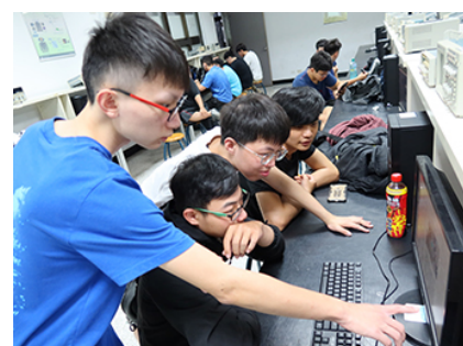
照片 3 說明：跨系結合激發創意