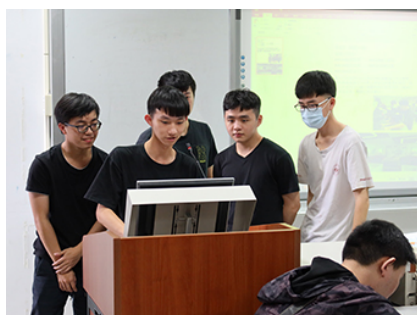
照片 2 說明：上台分享成果海報