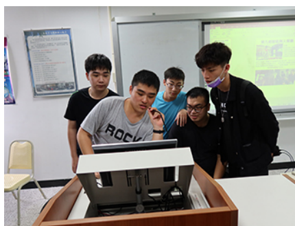
照片 5 說明：快樂分享互相學習