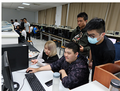
照片 1 說明：不同科系共同討論成果海報