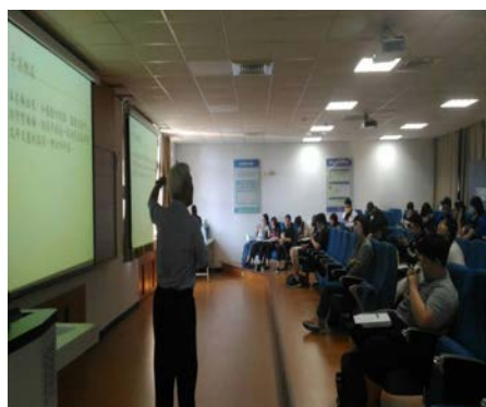
照片 4 說明：演講情形