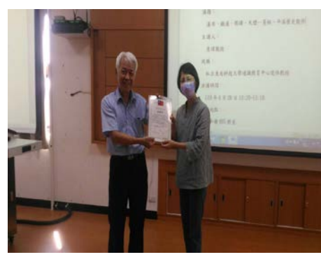
照片 6 說明：致贈感謝狀