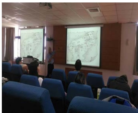
照片 5 說明：演講情形