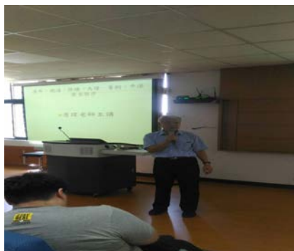
照片 2 說明：演講情形