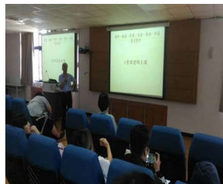
照片 3 說明：演講情形