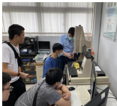
照片 4 說明：教學助理輔導