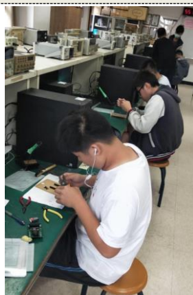
照片 5 說明：教學助理輔導