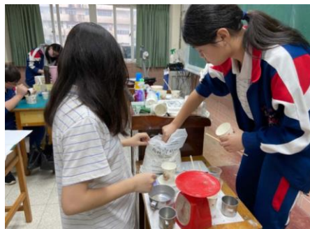
照片 2 說明：教學助理輔導