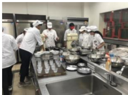
照片 1 說明：教學助理輔導