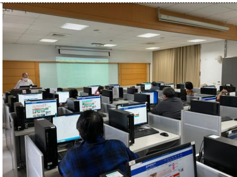
照片 1 說明：研習情形