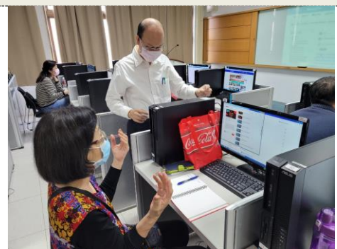
照片 3 說明：教師分享