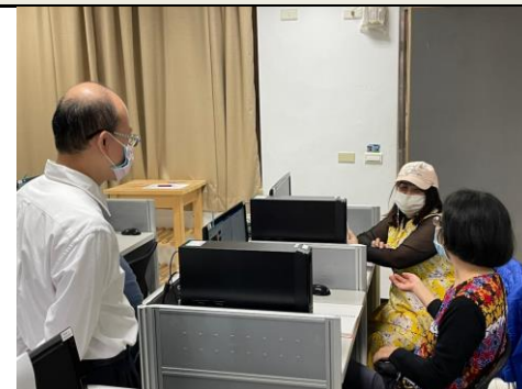
照片 5 說明：教師分享互動