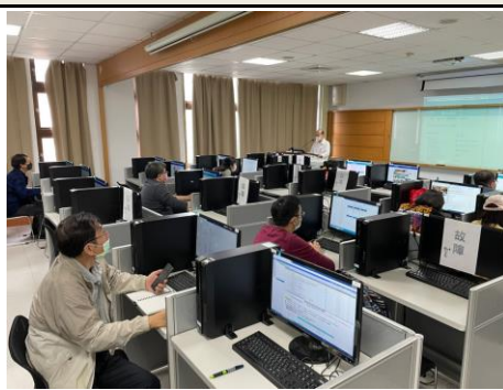
照片 6 說明：教學與演練