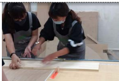
照片 1 說明：老師指導裁切過程