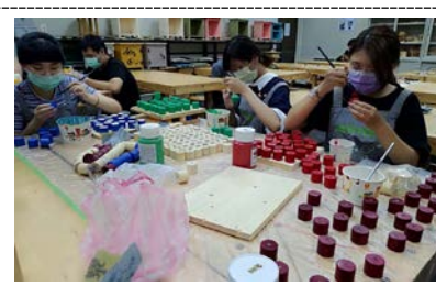
照片 3 說明：上色過程