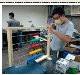
照片 5 說明：組裝過程