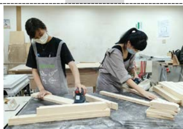
照片 2 說明：研磨過程