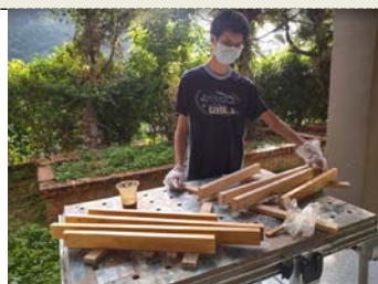
照片 4 說明：上漆過程