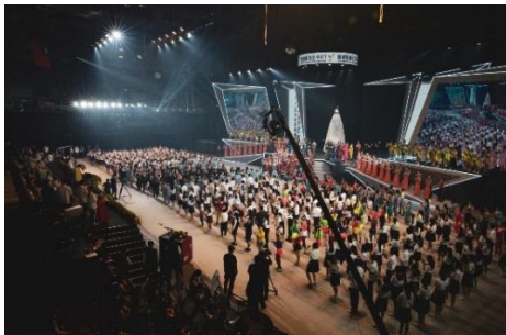
照片 2 說明：正式彩排