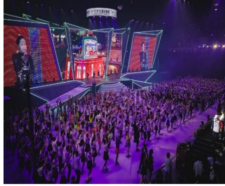
照片 5 說明：正式演出第二首+謝幕