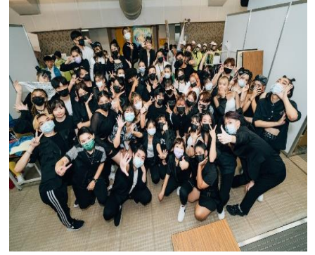
照片 6 說明：大合照