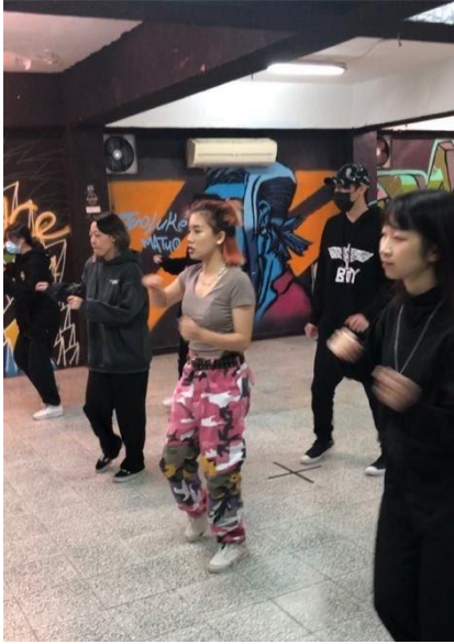
照片 4 說明：與藝人黃曷翔於校內排練