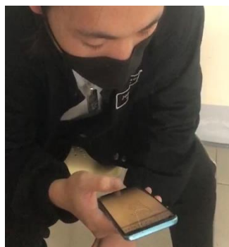
照片 2 說明：學生練習創作的音樂