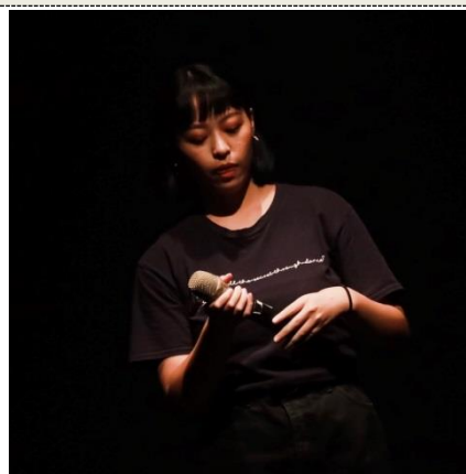
照片 4 說明：學生演出