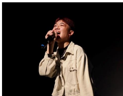
照片 5 說明：學生演出