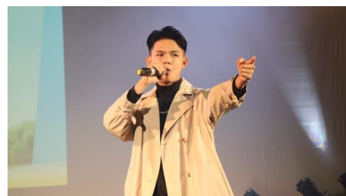
照片 6 說明：學生演出