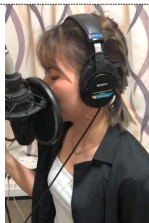
照片 3 說明：實際錄音樂