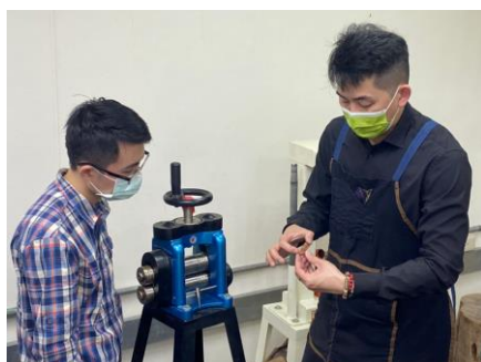
照片 5 說明：個別設計檢討