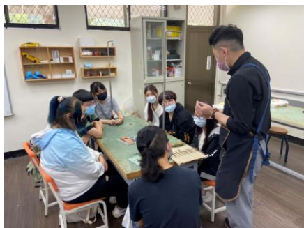
照片 1 說明：設計發想分組討論