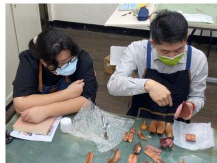
照片 3 說明：造形設計個別討論