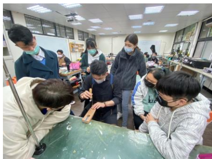
照片 2 說明：鋸切示範及實作