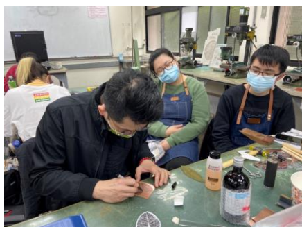
照片 4 說明：綜合實作技法示範