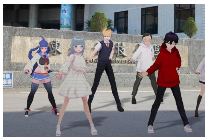
教材製作 24 輯