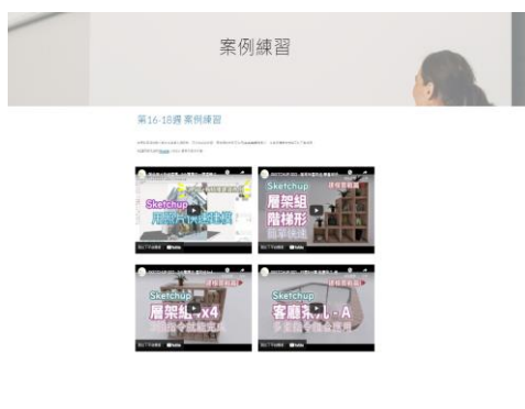
照片 5 說明：線上課程