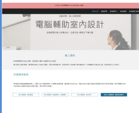
照片 4 說明：線上課程教學平台