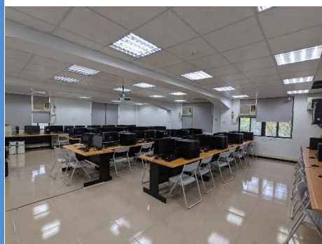
照片 1 說明：上課空間