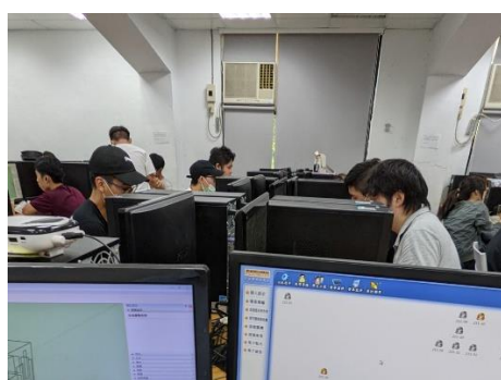
照片 2 說明：上課情形