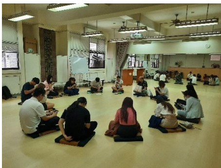
學生的文章閱讀對話練習(一)