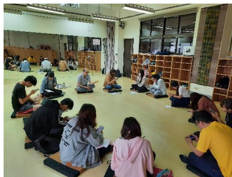
學生的文章閱讀對話練習(二)