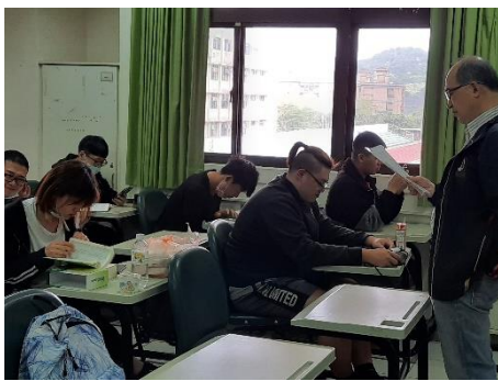
飛行機上常用接待日語