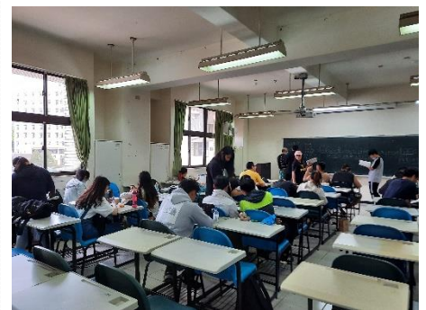
學生的實際接待禮儀日語對話練習