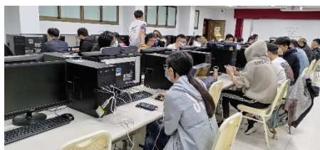
照片 5 說明：同學使用視訊擷取盒進行直播