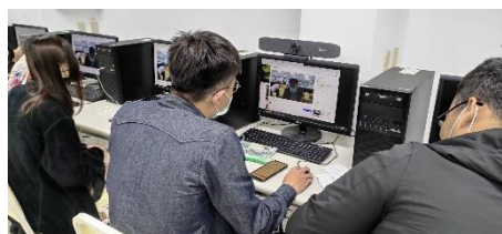
照片 4 說明：同學使用視訊攝影機進行直播