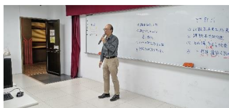
照片 1 說明：老師課堂講解