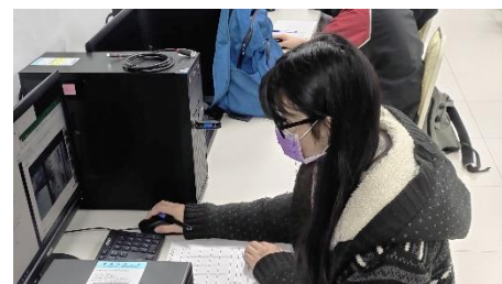
照片 6 說明：教學助理整理資料