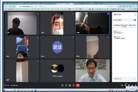
照片 6 說明：線上教學貼膜示範