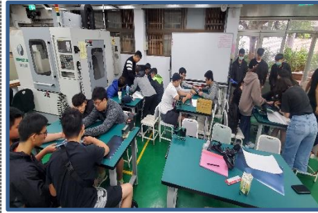
照片 3 說明：學生分組練習貼膜過程