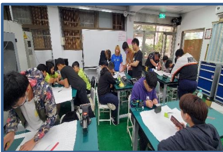
照片 5 說明：實戰演練-分組車殼施工