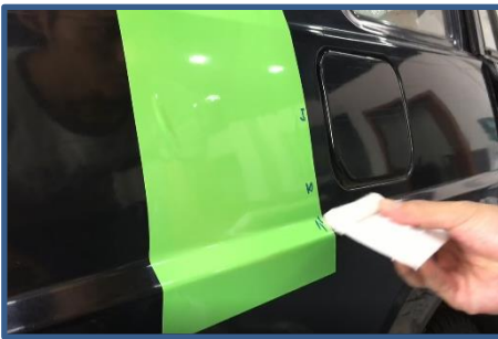
照片 2 說明：特殊折角工法練習