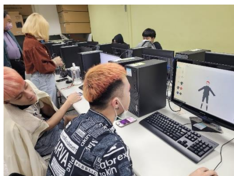
同學創作虛擬人物情形