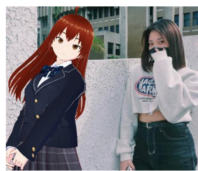
學生角色設計與合成情境照片(FB)