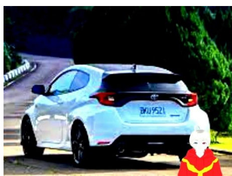
跨系組合作品創作