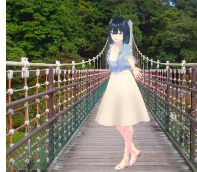
學生角色設計與合成情境照片(IG)