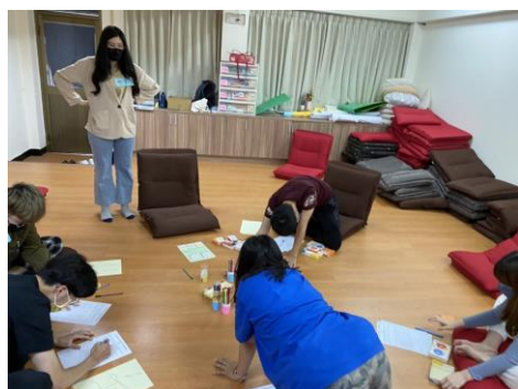
照片 4 說明：職涯諮詢小團體