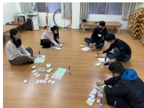
照片 6 說明：職涯諮詢小團體