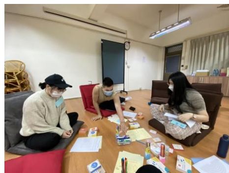
照片 3 說明：職涯諮詢小團體