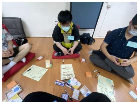
照片 1 說明：職涯諮詢小團體