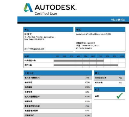
照片 6 說明：學生考取證照結果分析