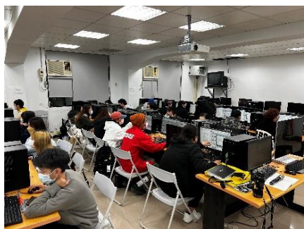
照片 1 說明：學生上課照片 1