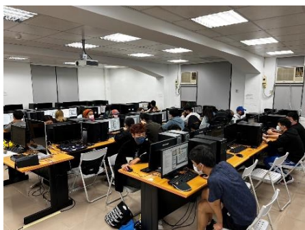
照片 4 說明：學生自行操作照片 2