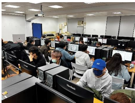
照片 2 說明：學生上課照片 2