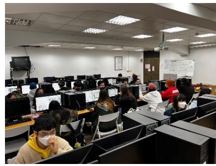
照片 3 說明：學生自行操作照片 1