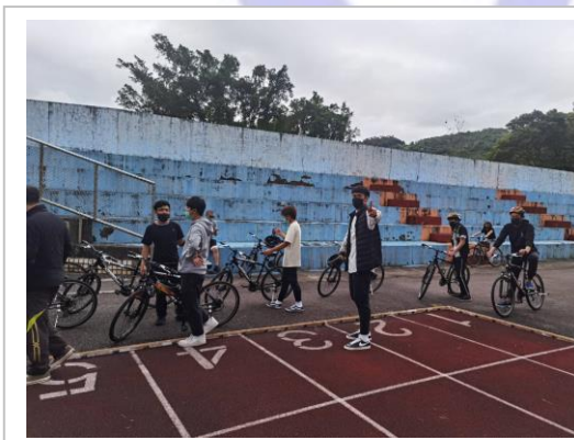
自行車騎乘技巧的練習