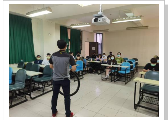
車行車的保養與維修教學