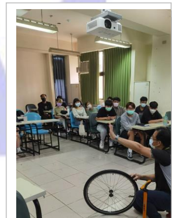
車行車的保養與維修教學