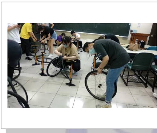
自行車內外胎更換的技巧練習