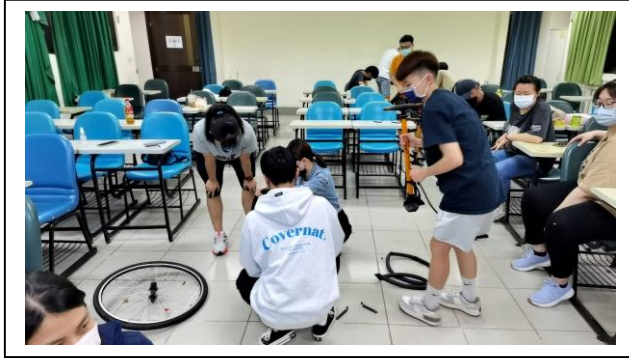
自行車保養與維修的分組練習