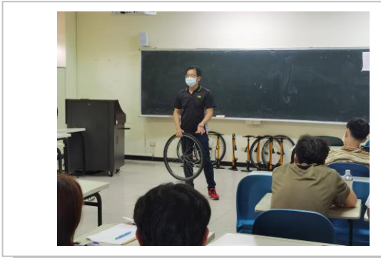
自行車內外胎更換的技巧教學