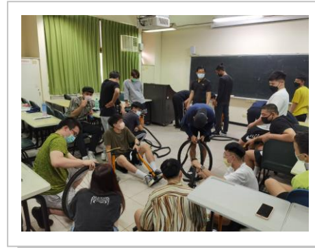
自行車保養及維修的練習