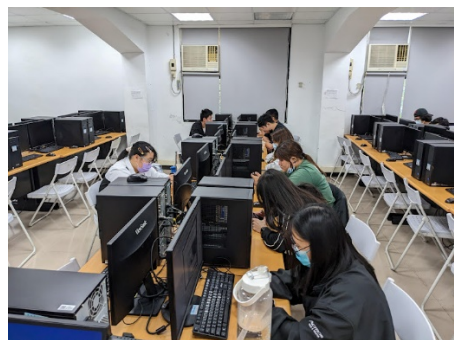
照片 1 說明：電腦與手機軟體教學