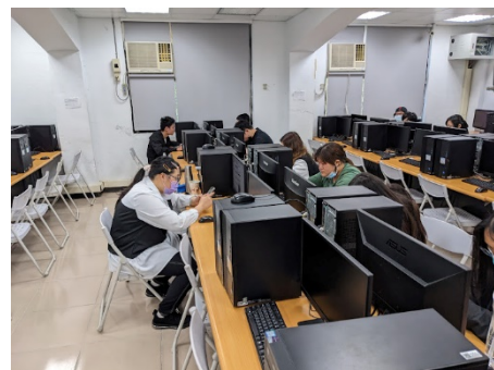
照片 3 說明：手機筆記 app 操作