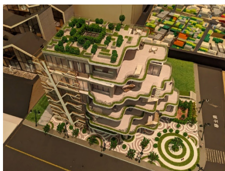
照片 5 說明：室設系空間與作品參觀