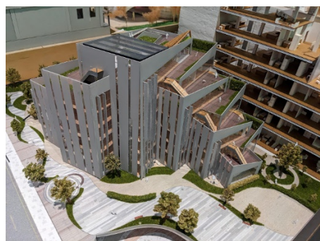
照片 4 說明：室設系空間與作品參觀