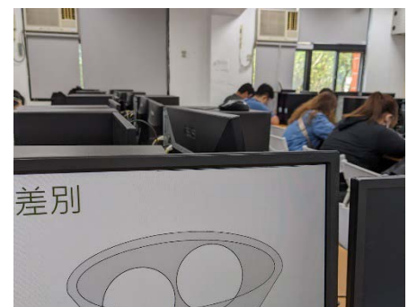
照片 6 說明：模型製作與材料介紹