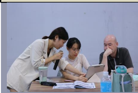
說明：第三天工作坊