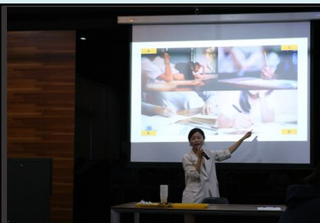
說明：第三天設計溝通