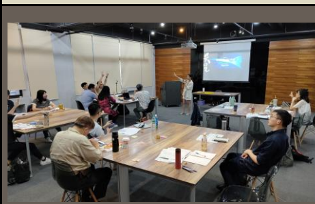
說明：第四天工作坊