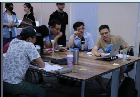
說明：第二天工作坊