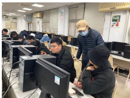
照片 5 說明：教師與學生課堂討論