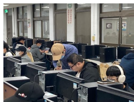
照片 3 說明：教師輔導學生製作動畫