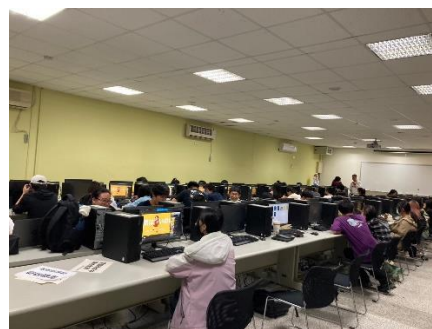
照片 6 說明：學生上課學習成效良好