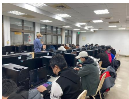
照片 4 說明：學生上課學習成效良好