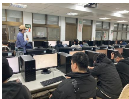
照片 1 說明：學生上課學習成效良好