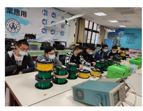
照片 6 說明：光纖接續與 OTDR 操作檢測