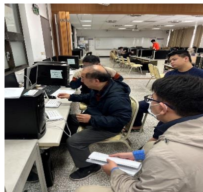
照片 4 說明：路由器設定