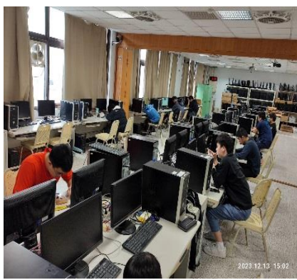
照片 2 說明：上課實況