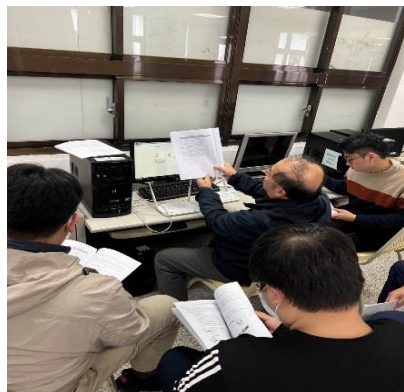
照片 1 說明：無線網路設備架設