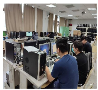
照片 5 說明：網頁及檔案伺服器架設