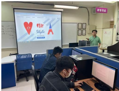
圖 3 大型活動執行介紹