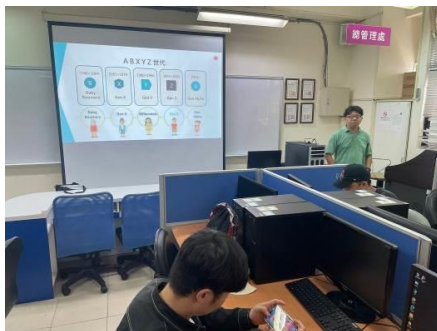
圖 5 認識活動族群