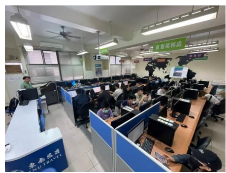
圖 4 大型活動策劃細節