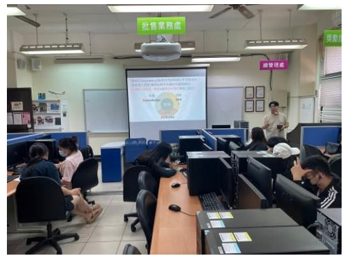
圖 2 活動企劃基本概念(二)