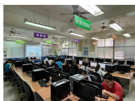
圖 8 休閒活動話題行銷(二)