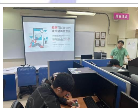
圖 6 故事行銷的魅力