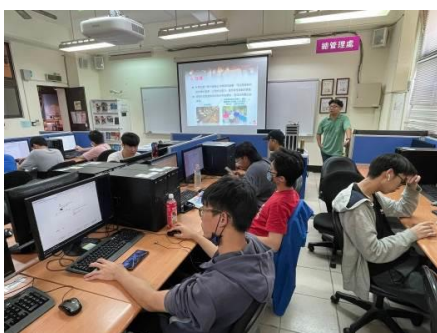
圖 7 休閒活動話題行銷(一)