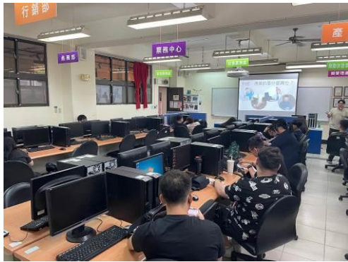
圖 1 活動企劃之基本概念(一)