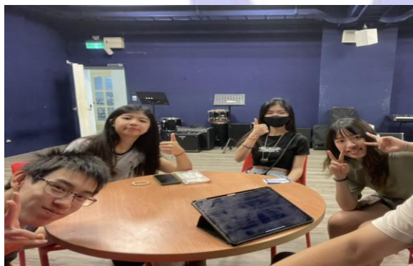
系展樂團與歌手細節討論