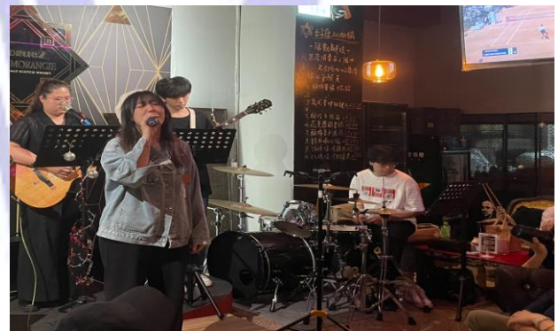
學生 vogue2 實戰演出