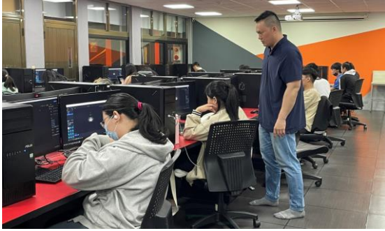
教師輔導學生學習