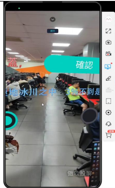
混合實境手機執行畫面截圖