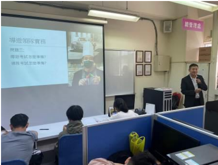
圖 3 領隊導遊的從業資格