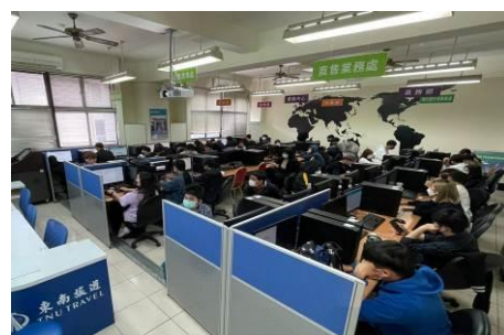
圖 8 學生專心聆聽