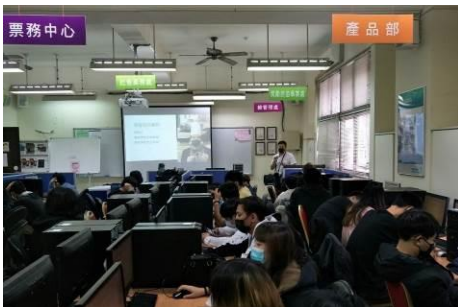
圖 5 領隊導遊人員