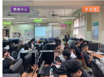
圖 2 領隊導遊與旅遊業