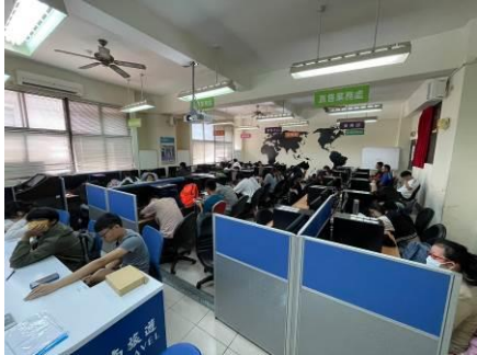
圖 1 領隊導遊之多少