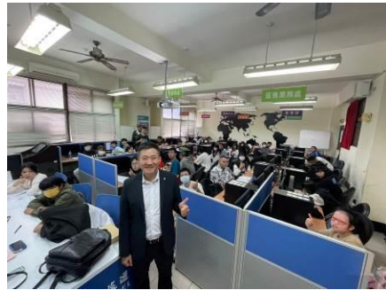
圖 4 講師與學生合照