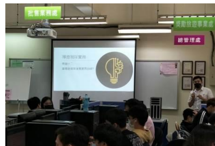
圖 6 領隊導遊充電站