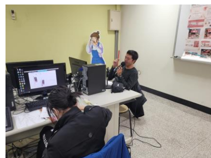
老師上課教學情景