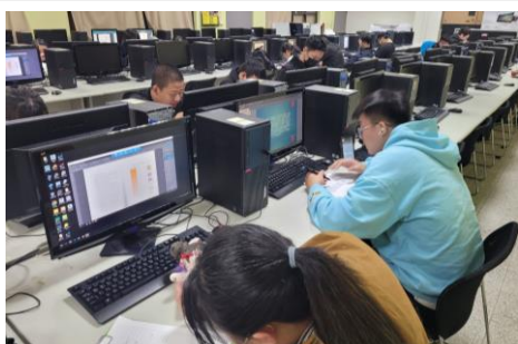
學生構思色稿情景