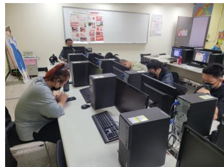
老師上課教學情景