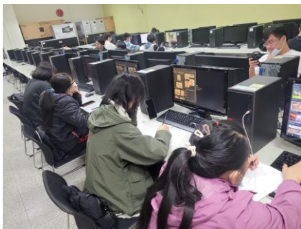
學生構思草圖情景