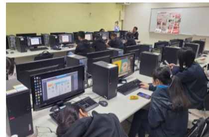
老師上課教學情景