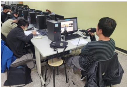
老師上課教學情景