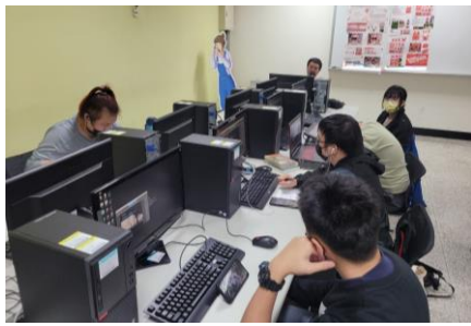
老師上課教學情景