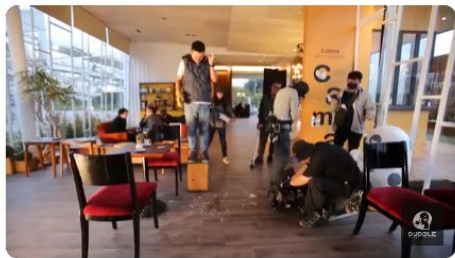
【Stay 歸路】【Perfect 無暇】幕後直擊