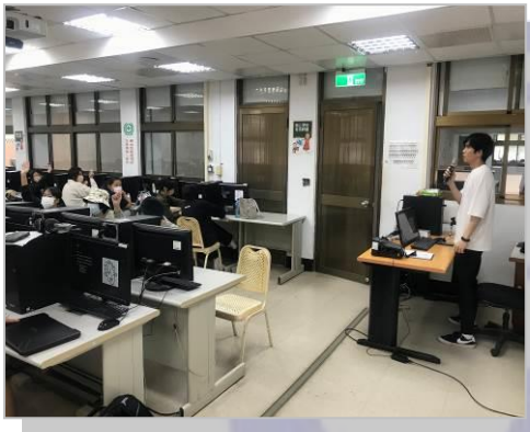
業師分享遊戲業界概況