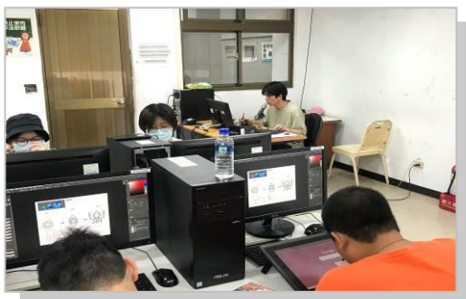
學生實作遊戲美術設計