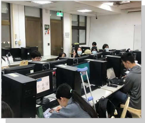
學生上課學習狀況良好