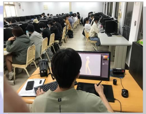
業師示範遊戲角色設計