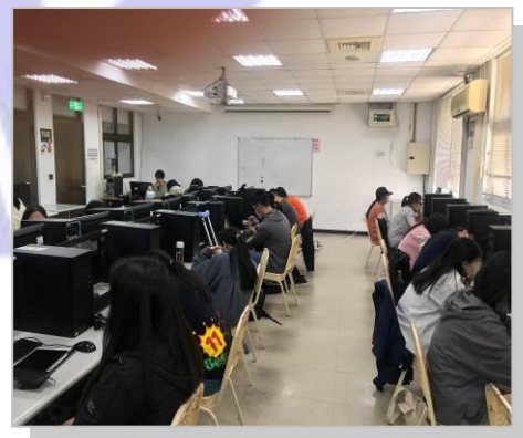
學生上課學習狀況良好