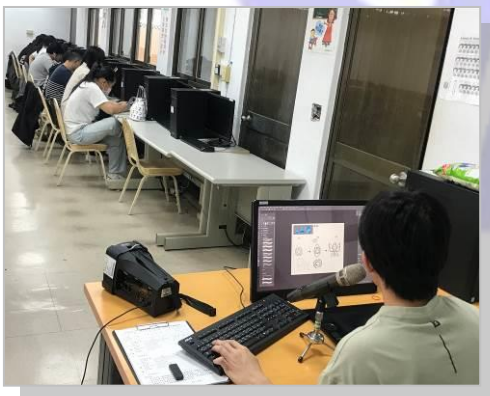
業師示範遊戲美術設計