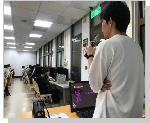
業師分享遊戲業界概況