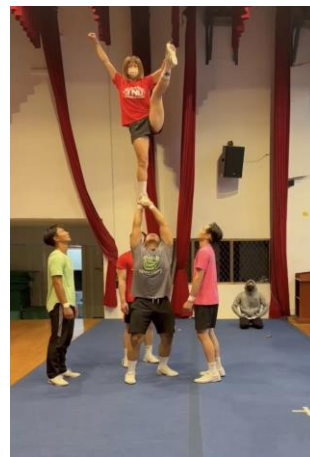
照片 6 說明：雙人單底層流程練習