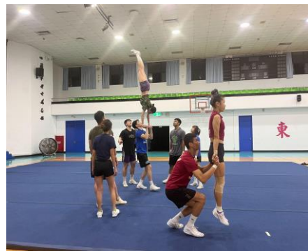
照片 2 說明：進階單底層