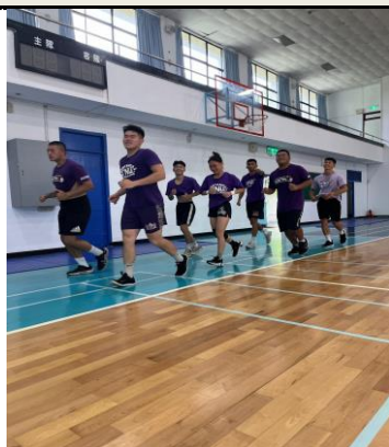
照片 1 說明：體育館內慢跑熱身