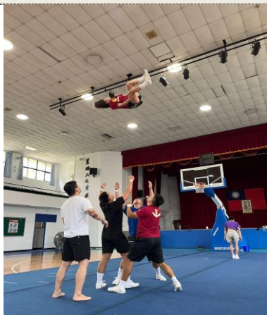
照片 3 說明：空拋進階動作練習