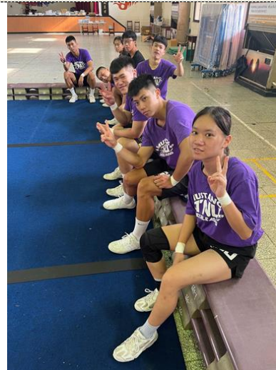
照片 8 說明：新興聯合練習第二天 體操練習合影