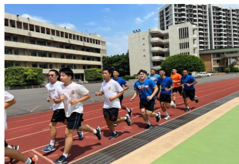
照片 2 說明：新興聯合練習第一天心肺訓練