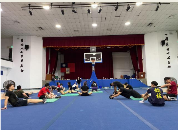
照片 3 說明：核心肌群加強