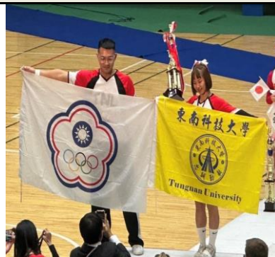
照片 6：雙人組 本校啦啦隊校友獲得亞軍