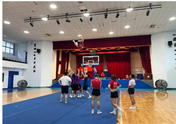
照片 2 說明：空拋前置動作複習