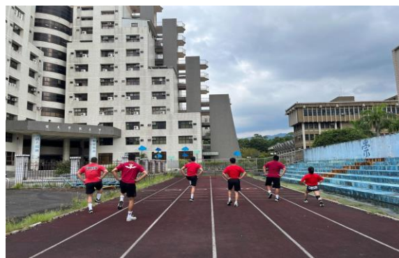
照片 4 說明：下肢肌力訓練