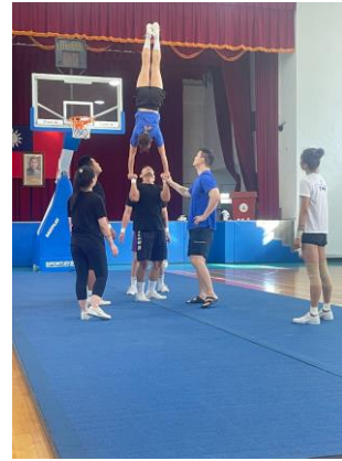
照片 6 說明：單底倒立姿技術練習