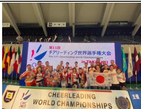
照片 5：台灣競技啦啦隊項目 得獎隊伍合影