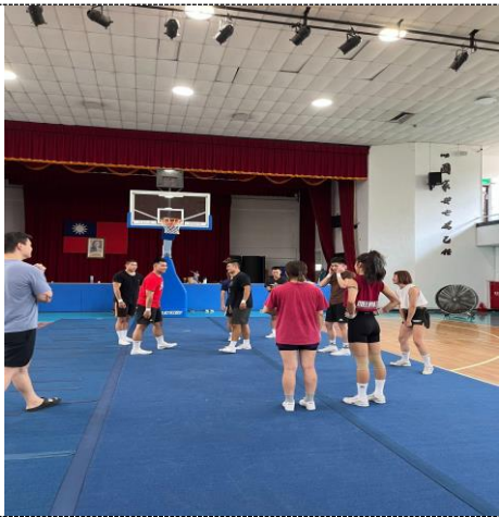
照片 1 說明：將適合的人選固定分為同一組。