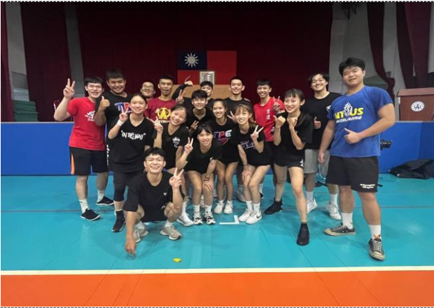
照片 5 說明：與台體大聯合練習結束合影