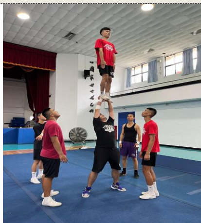
照片 3 說明：單底層基本動作練習