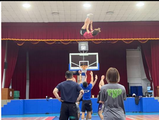
照片 1 說明：空拋練習