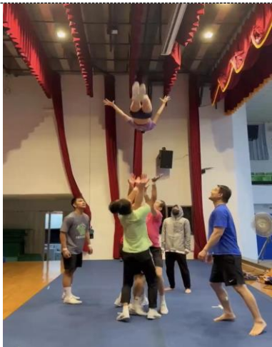
照片 5 說明：四人組多底層流程練習