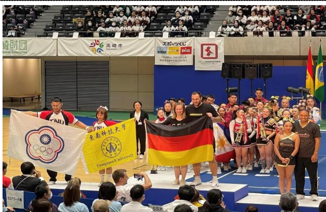
照片 1：參加 2023 世錦賽技巧雙人組,前三名頒獎中