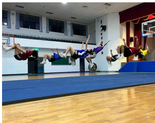
照片 4 說明：原地後空翻練習