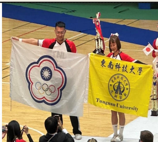
照片 4：雙人組 本校啦啦隊校友獲得亞軍