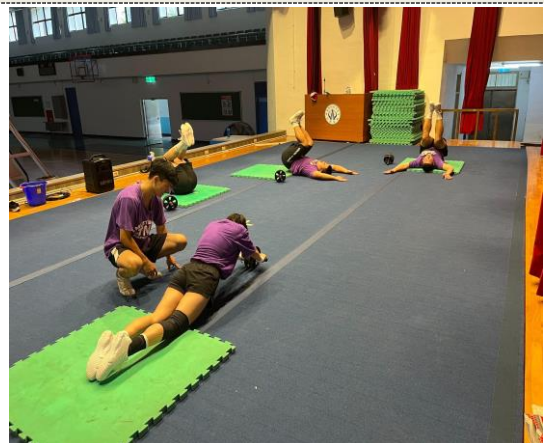
照片 4 說明：核心肌群加強