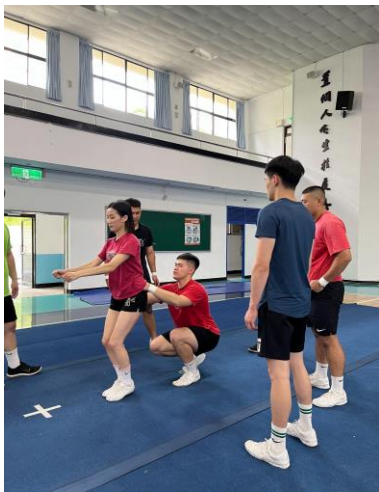
照片 7 說明：學長姐空翻上單底技術指導