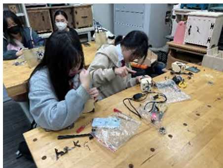
照片 2 說明：競賽作品製作