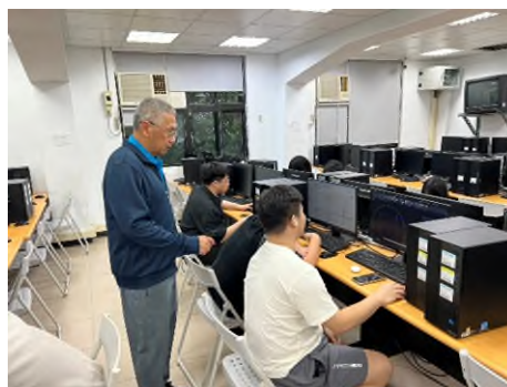
照片 5 說明：電腦 AutoCAD 證照輔導操作