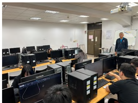
照片 4 說明：電腦 AutoCAD 證照輔導