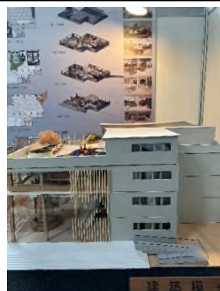
照片 3 說明：競賽作品完成