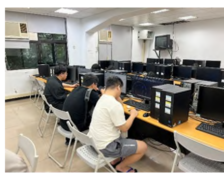
照片 6 說明：AutoCAD 證照考試